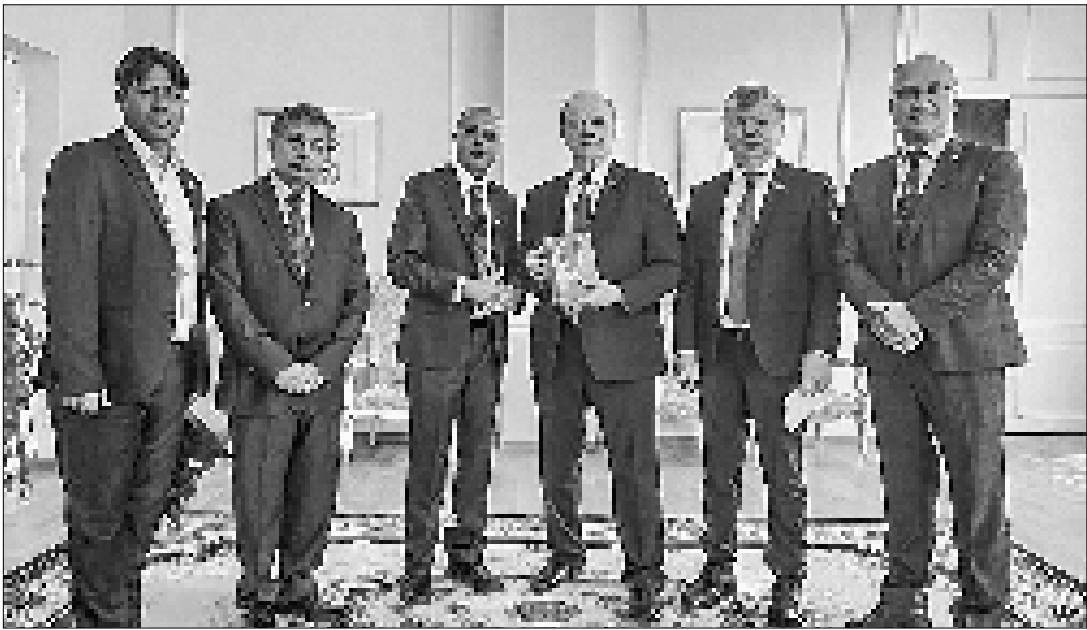
тельной политической силой. В настоящее время её представители возглавляют правительственную и занимают в нём ряд ключевых постов. Партия имеет свыше 80 депутатских мест в парламенте.

переговоров подчеркнули готовность укреплять межпартийные связи и содействовать наращиванию экономического, политического и культурного сотрудничества между народами двух стран. Доктор Раджан Бхаттарай — авторитетный непальский политик, известный своей разнообразной государственной, научной и общественной деятельностью. В настоящее время он входит в состав Центрального Комитета Компартии Непала (ОМЛ) и руководит её международным отделом. Коммунистическая партия Непала (ОМЛ) является влия-