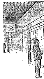
A Segurança Só erros no final do